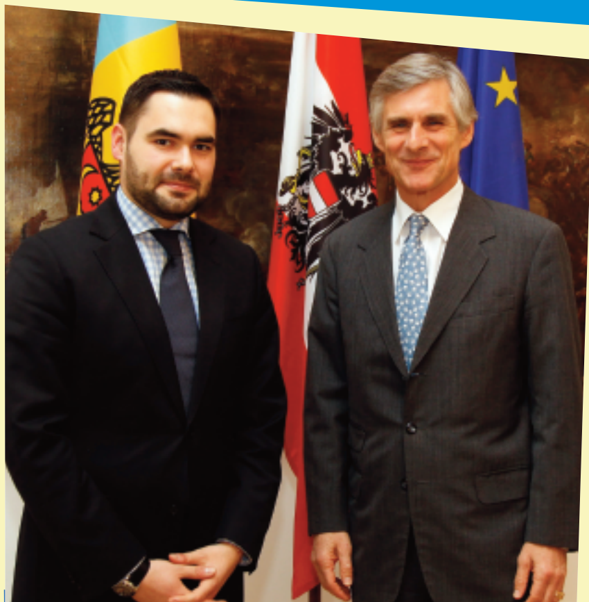
Împreună cu Secretarul general al Ministerului Federal pentru Afaceri Externe și Europene al Austriei, Michael Linhart, 27 martie 2014

- Și da, și nu. Ca principii generale de interacțiune cu Uniunea Europeană putem spune că sunt asemănătoare. În rest, prevederile concrete din cele trei Acorduri de Asociere au fost negociate individual, în raport cu realitățile din fiecare țară în parte. Spre exemplu, Republica Moldova nu are industria Ucrainei. De aceea, în cazul nostru accentul s-a pus pe agricultură și pe industria agroalimentară. Mai curând, avem tangențe cu Georgia - suntem comparabili și ca teritoriu, și ca populație, și în materie de conflicte interne cu care ne confruntăm. Până și embargourile ce ne-au fost impuse sunt asemănătoare și... contraproductive. Dar, aceeași Georgia a demonstrat că se poate avansa în pofida dificultăților.