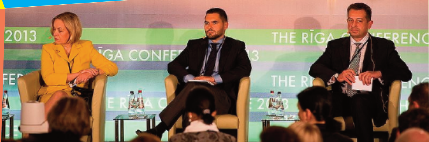
Viceministrul Afacerilor Externe, Iulian Groza, la Conferința de la Riga, 6-7 septembrie 2013

În ultimii ani, am beneficiat de o asistență financiară esențială din partea UE. Dar toate aceste granturi și asistență tehnică ne-au fost oferite pentru ca, într-un final, să putem asigura condiții propice pentru atragerea investițiilor. Asistența financiară ne ajută pe termen scurt să ne consolidăm instituțiile, dar pe termen mediu și lung investițiile sunt vitale - pentru modernizarea liniilor de producție, pentru a exporta mai mult, pentru a majora numărul locurilor de muncă.