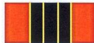
BARETA DE SUBSTITUIRE